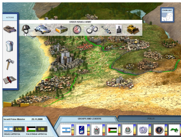
Abbildung 1: Das Interface

Eine visuelle Ebene der Instruktion ist unmittelbar augenscheinlich: Im Zentrum des Interfaces prangt eine Karte des Konfliktgebiets, links daneben ein Menübalken, aus dem Handlungsoptionen gewählt werden können und unten ein weiterer Balken, in dem Parameter politische Akteure der Region anzeigen (siehe Abbildung 1). Die Parameter und Optionen tragen Namen, doch aufgrund ihrer Visualität sind sie auch unmittelbar verständlich, da sie vorbestehende Symbole aufgreifen (z.B. Nationalflaggen). Auch die Handlungsoptionen werden durch Piktogramme indiziert, beispielsweise kennzeichnet das Bild eines Panzers den Menüzeitpunkt für Sicherheitspolitik („Security“). Das Piktogramm denotiert also etwas Bestimmtes (einen Panzer), konnotiert jedoch ein Allgemeines (das Militärische). Das Bild des Panzers fungiert so als visuelle Analogie auf eine Kategorie von Handlungen. Zugleich werden evaluative Assoziationen impliziert, denn alle Maßnahmen der Sicherheitspolitik stehen nun im Schatten des Militärischen.